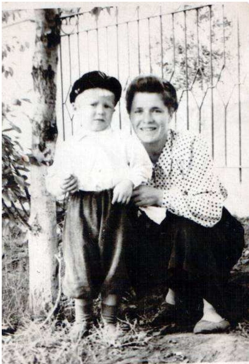
Мама с сыном