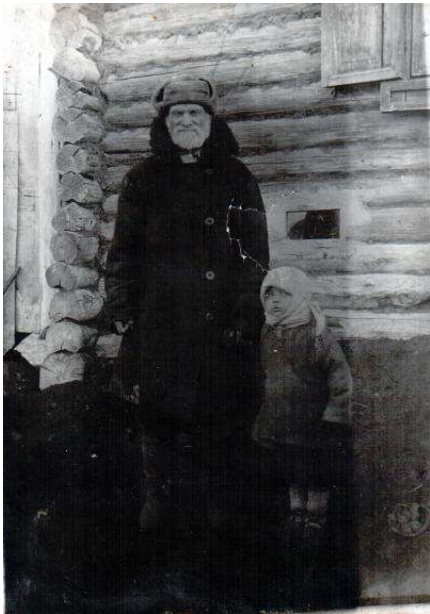
Дед и внук. 1955 г.